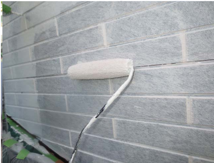
外壁の下塗材を塗装しています。