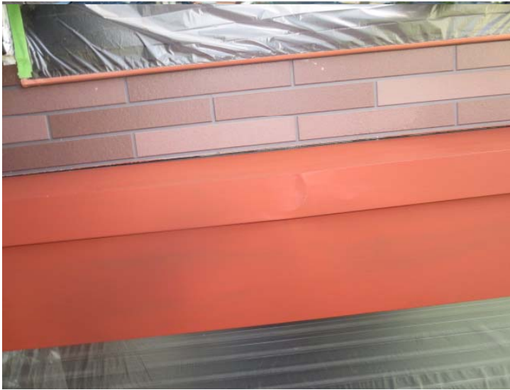
シャッターボックス錆止め塗装後。